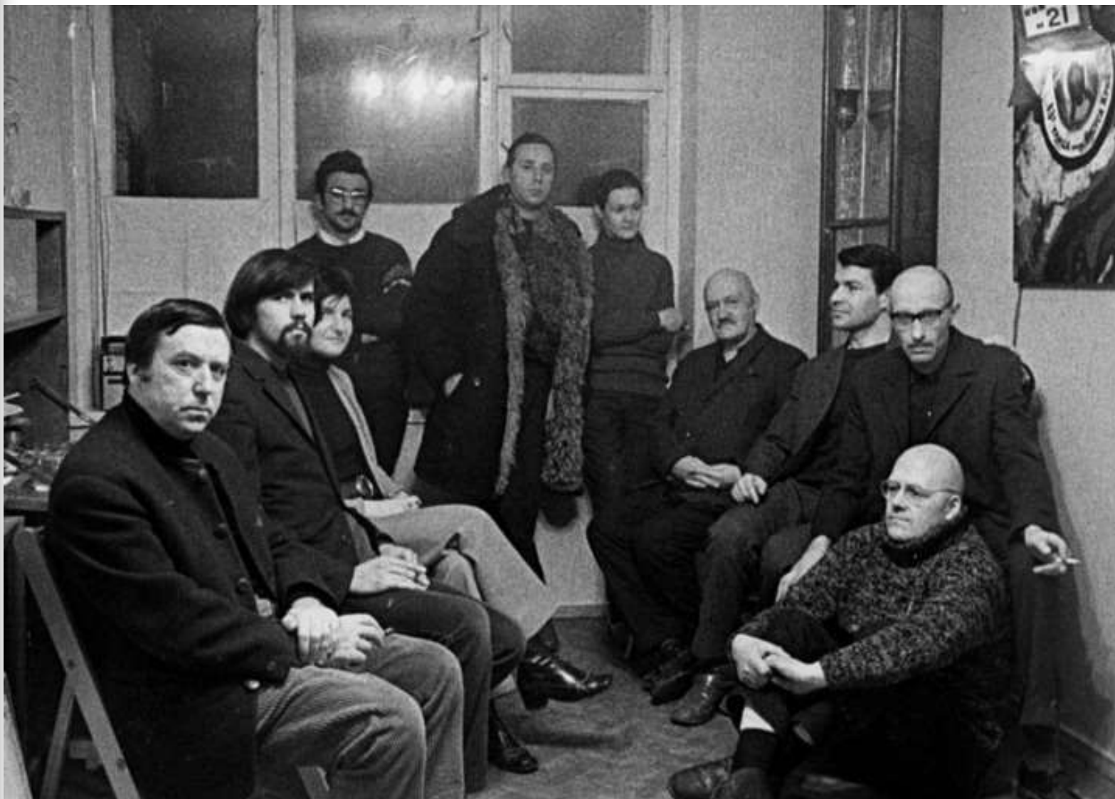
Поэты-неформалы Лианозовской группы