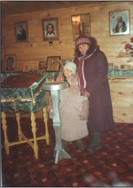
Мой класс на экскурсии в часовне